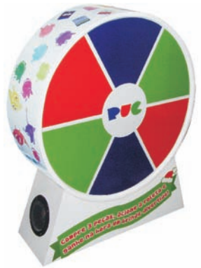
Premiador de Balcão